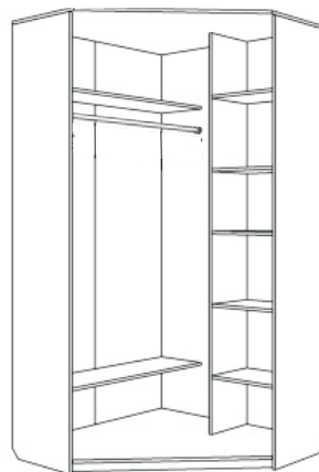
Изделие в сборе